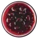
Sweet Cherry 스위트 체리