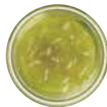
Green Grape 청포도