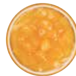
Apple Cinnamon 애플시나몬