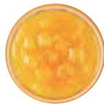
Apple Mango 애플망고